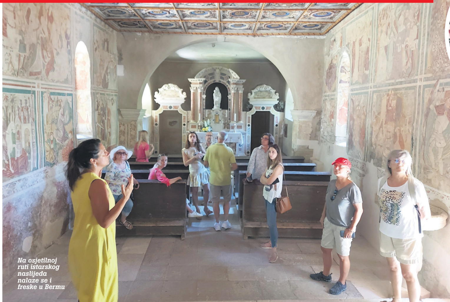
Na osjetilnoj ruti istarskog naslijeđa nalaze se i freske u Bermu